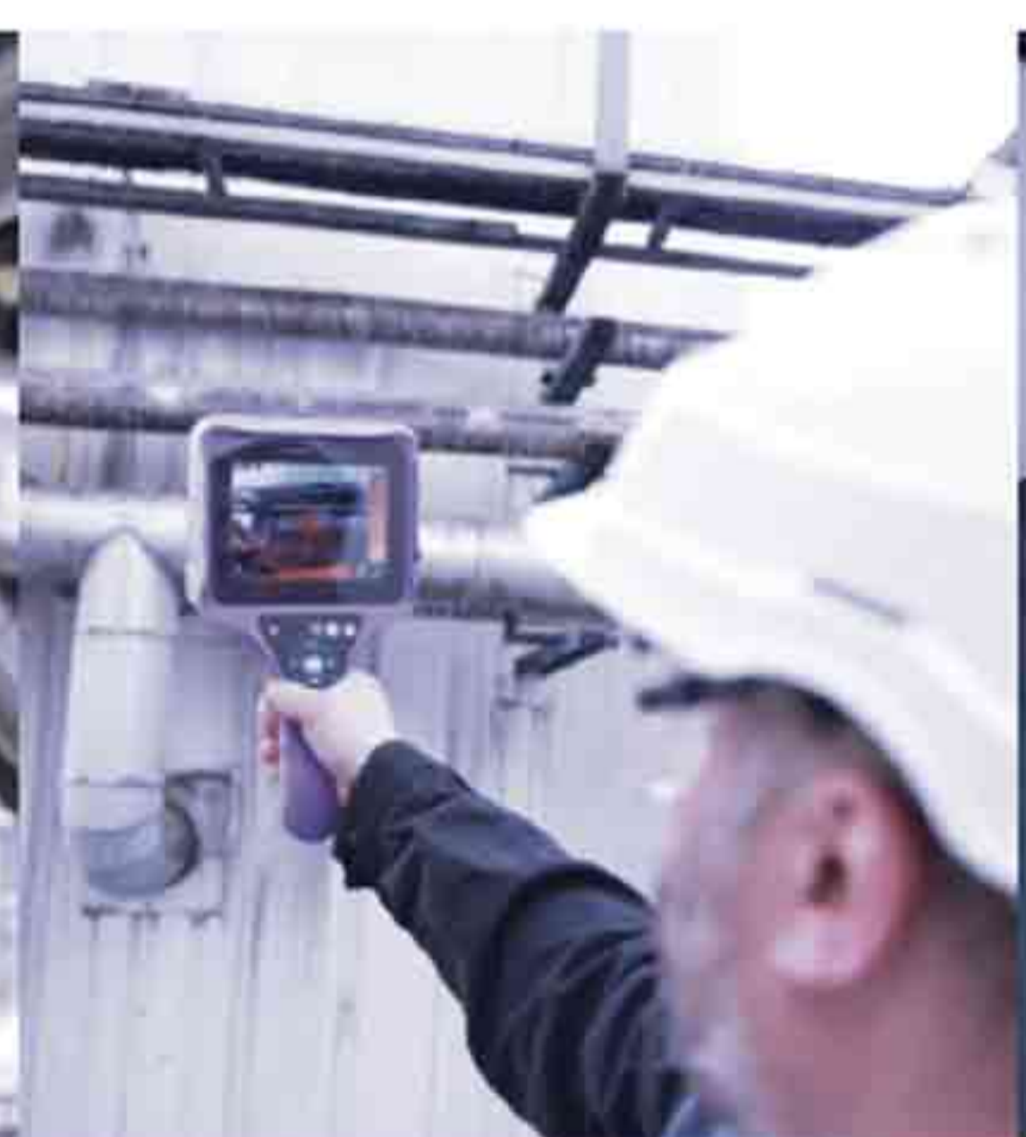
STEAM TRAP INSPECTION