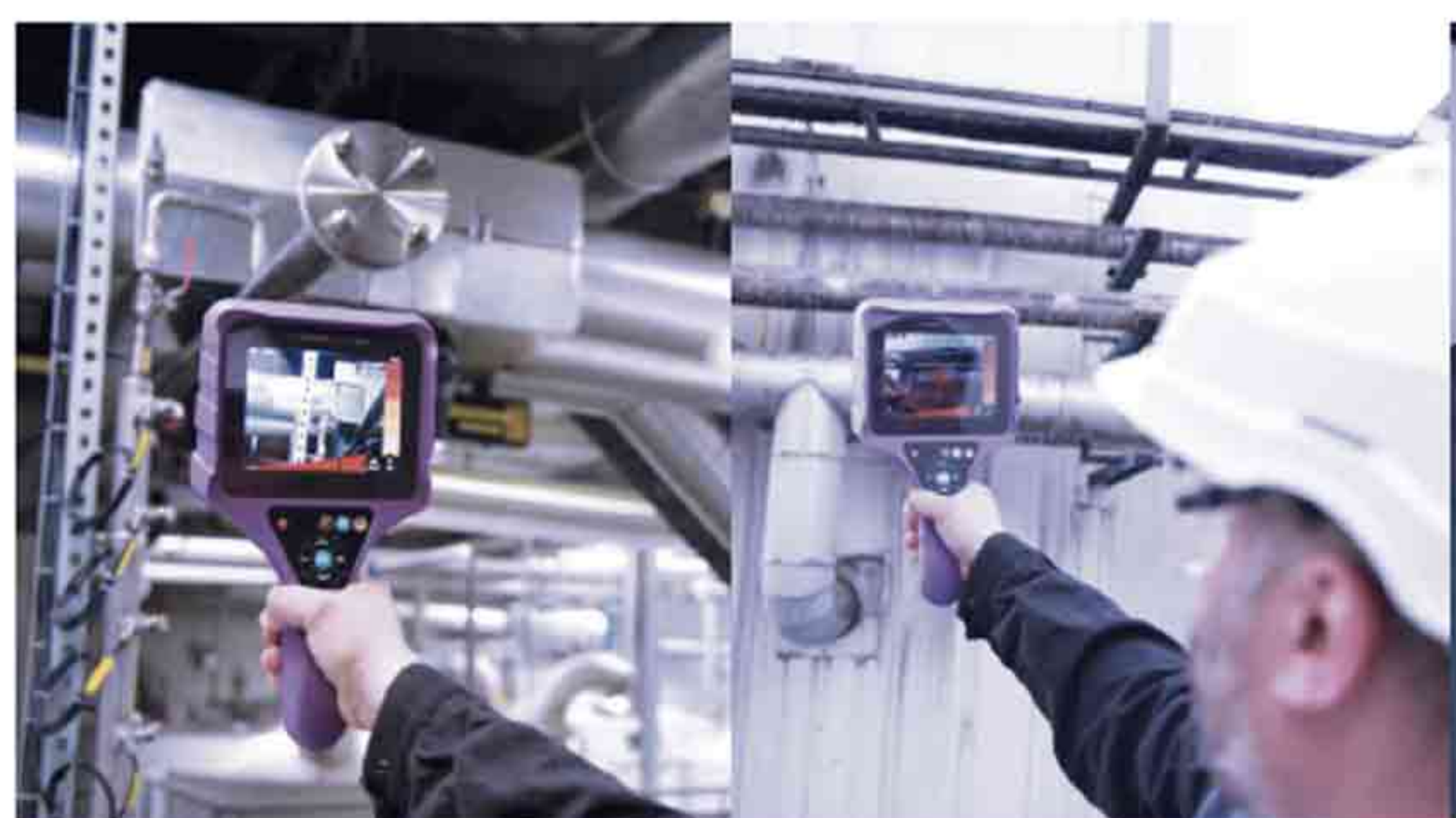
COMPRESSED AIR LEAK DETECTION